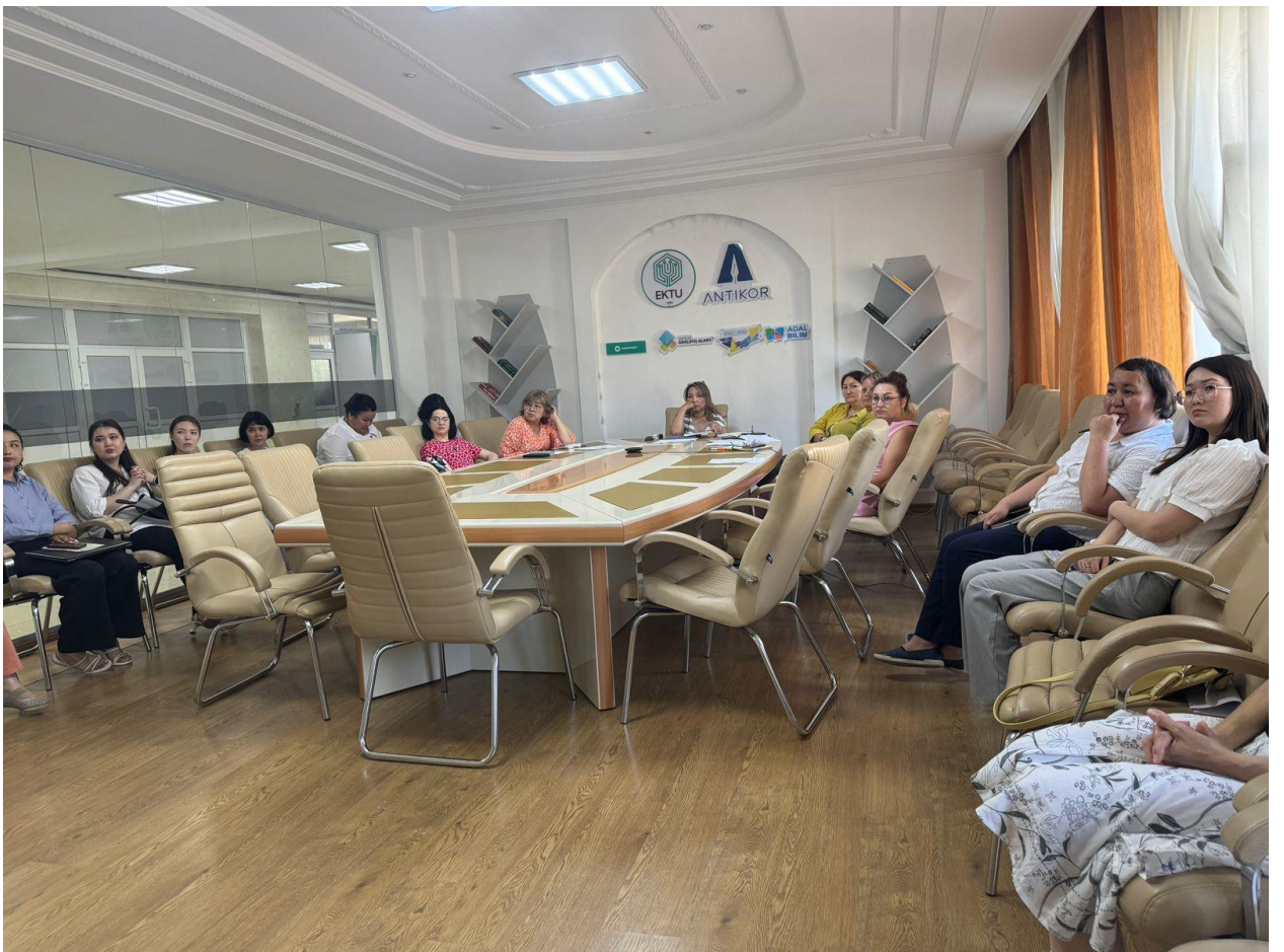
Руководитель проекта «Капитал будущего»